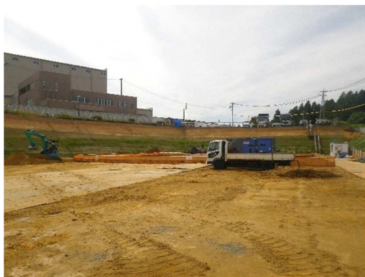
・建設地 北側 (令和7年6月13日撮影)