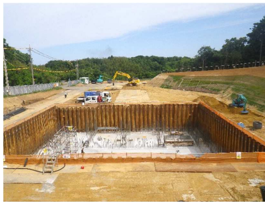
・建設地 南側 (令和7年6月13日 撮影)