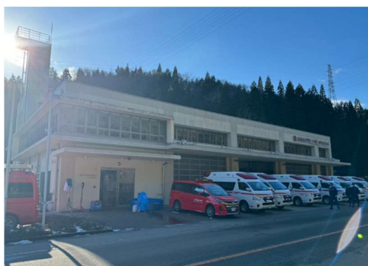
緊急消防援助隊（救急小隊）

しかし、地震で被害を受けた能登地方の道路では、通行できる道路でも隆起や陥没などがあり、段差で乗用車などが故障して動けなくなることで渋滞が起き、緊急消防援助隊や医療支援・支援物資・災害復旧などの車両の通行に支障が出る事態も起きています。能登地方への不要不急の移動は控え、災害優先車両などの通行にご理解とご協力をお願いいたします。